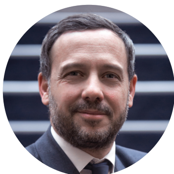
ADRIEN TAQUET Secrétaire d'État

Cette stratégie sera également un lieu de dialogue entre l'Etat et les départements. À rebours d'une vision rigide et datée des enjeux de répartition des compétences (et donc des financements), mon souhait est que nous puissions, de manière pragmatique, améliorer les pratiques et les modes de faire, pas à pas et de manière concrète, sur des sujets aussi essentiels que les délais d'exécution des mesures de justice, les déplacements multiples que subissent certains enfants, le suivi en santé, les impasses de la prise en charge du handicap et de la santé mentale en protection de l'enfance.